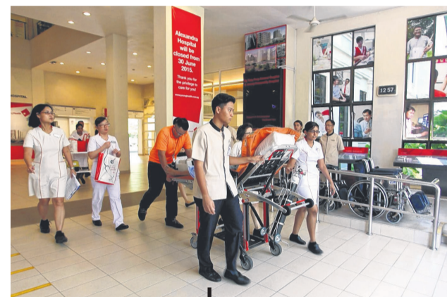
6月 | 黄廷方综合医院投入服务。