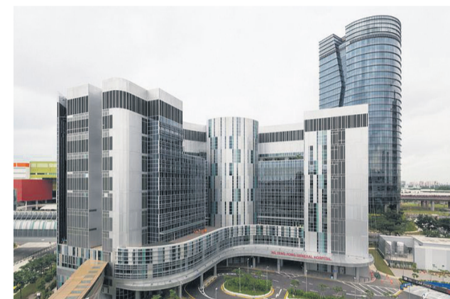
2015年2月 | A座大楼获得临时入伙准证。