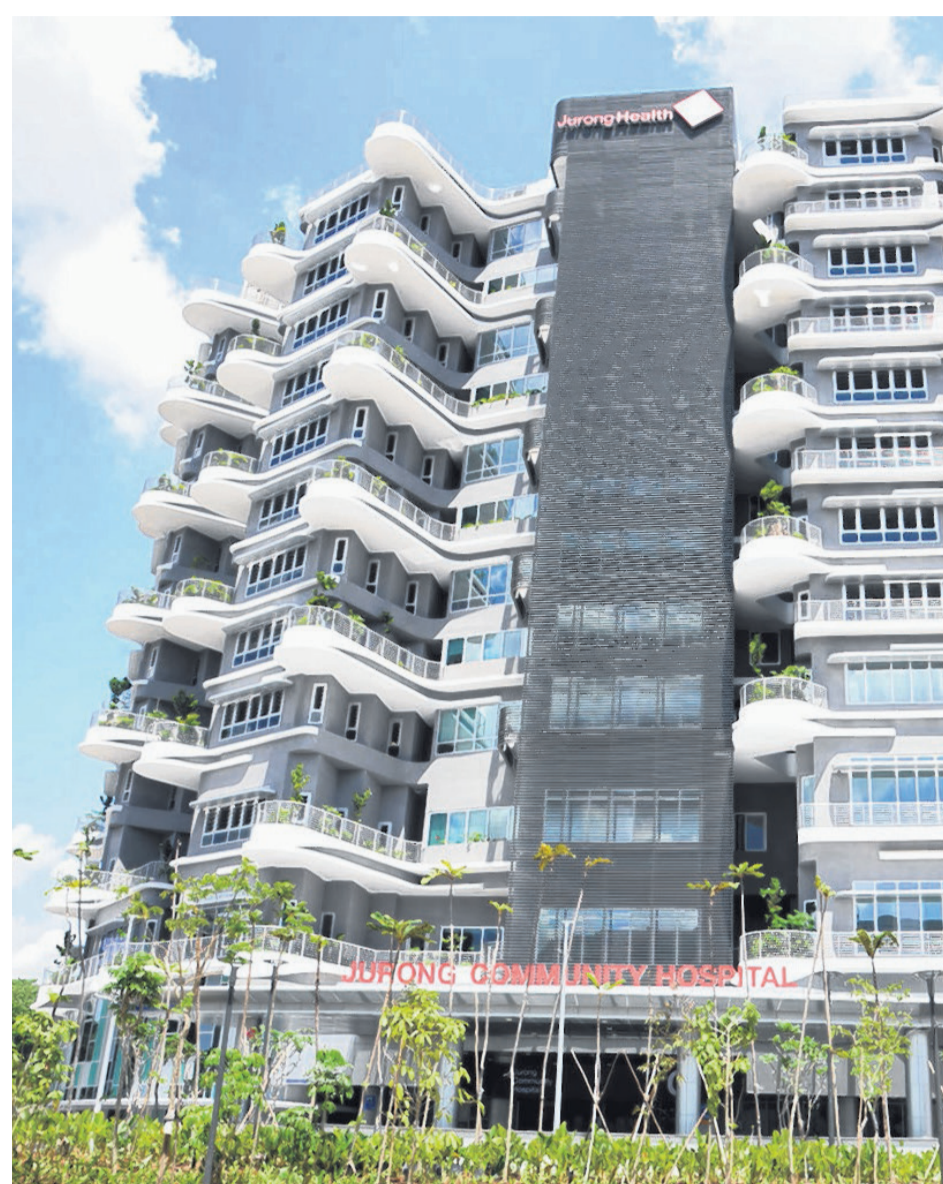
从裕廊社区医院的外观，根本看不出这是一个医疗设施，这也是院方在设立医院时的巧思之一。

的病患，不会因为环境的改变而感到不安。此外，每个病房的不远处都设置专属的厕所和护士工作台，让护士能更快地应对病患的一些突发情况。