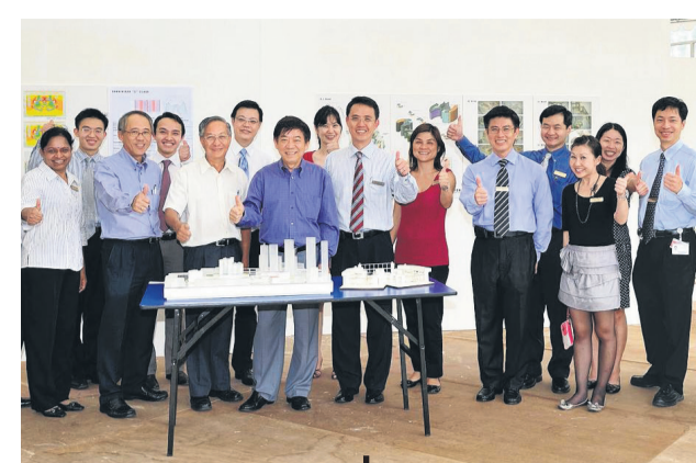
2010年1月 | 前卫生部长许文远 (前排左四) 参观医院模型。

今年6月29日，院方把亚历山大医院的留医病人转移到新医院，隔天上午8时黄廷方医院敞开大门，正式投入服务。10月10日两家医院—黄廷方综合医院和裕廊社区医院正式开幕。