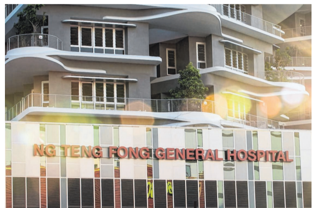
10月 | 两医院正式开幕。